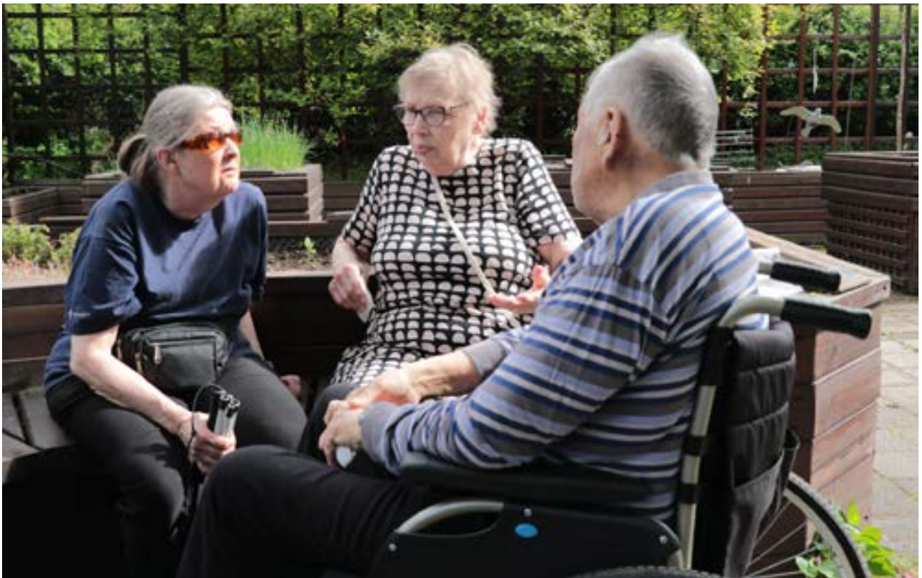
Jäsentapaamisessa Aistipuutarhassa oli mukava keskustella tuttujen kanssa.