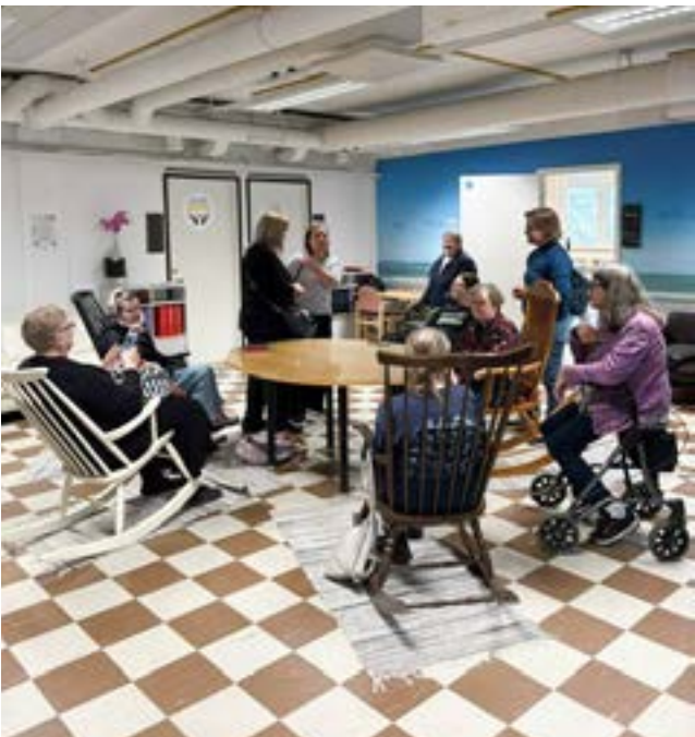
Pöydän ympärillä oli hyvä keskustella.