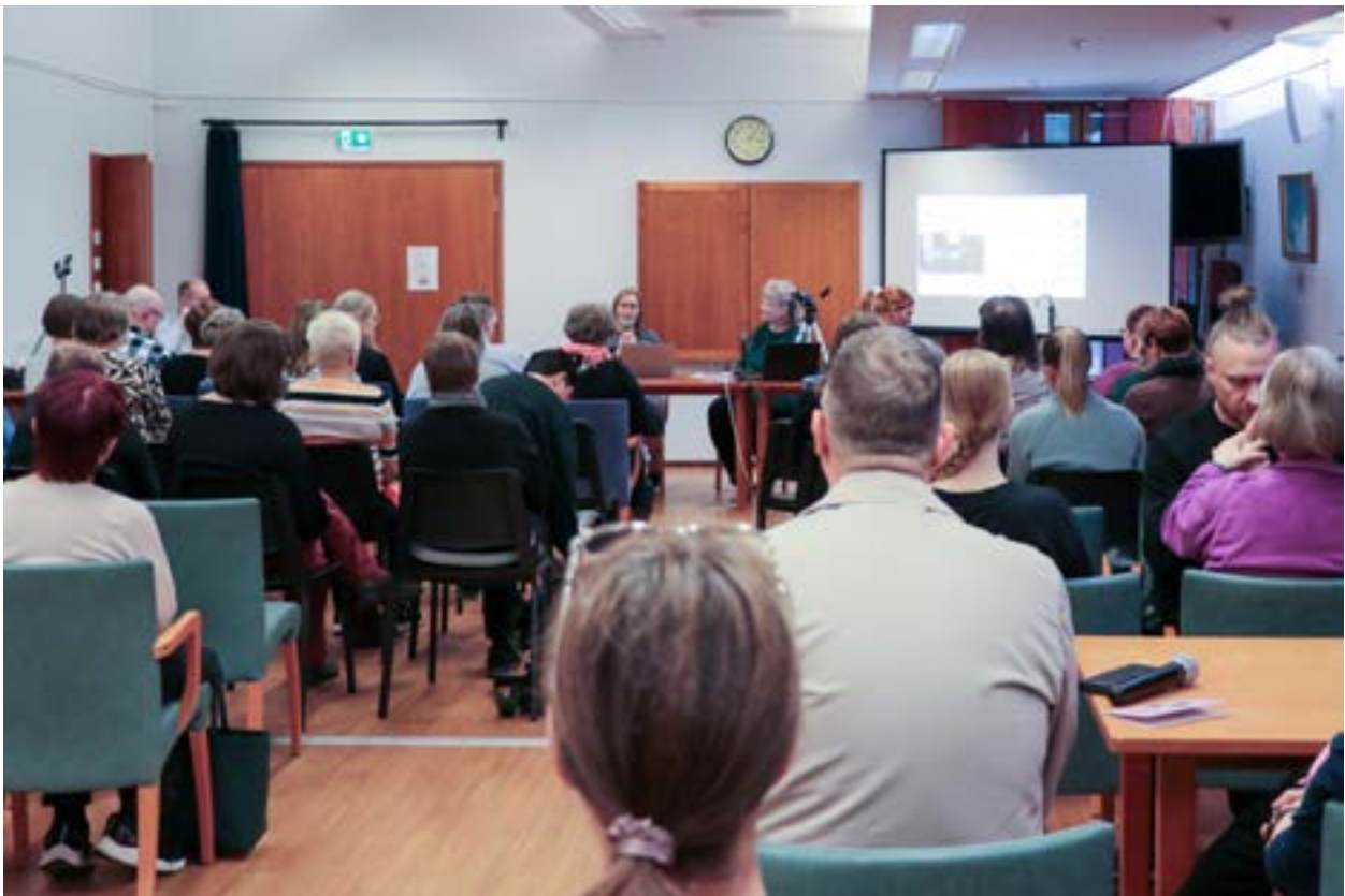
Yleisöä Martti Kemppi -salissa, Kuurosokeiden Toimintakeskuksella.