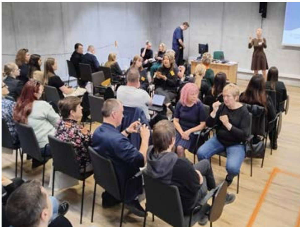
Foorumin osallistajat seuraamassa ohjelmaa