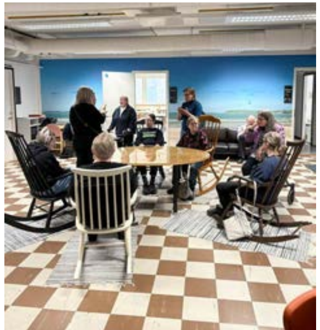
Keinutuoleissa oli mukava kiikkua ja rupertella muiden kanssa.