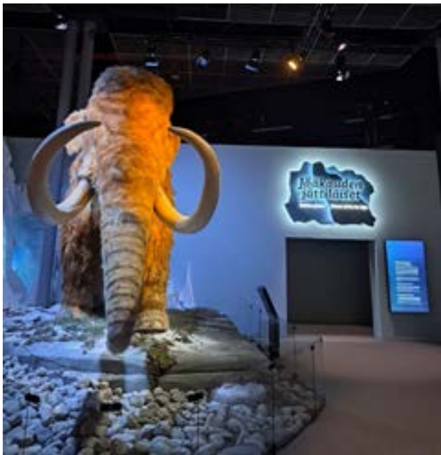
Ylempi kuva: Mammutti näyttelyssä. Oikealla: tunnistettava pienoismalli.

Osallistujien kokemusten mukaan moniaistillinen kuvailu auttoi hahmottamaan näyttelyn kohteita paremmin ja teki museokäynnistä selkeämmän ja osallistavamman. Kun tietoa välitettiin useamman aistin kautta, kokonaisuus oli helpompi hahmottaa.