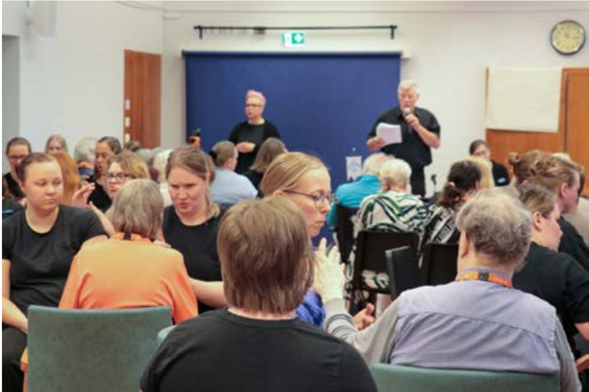
Jäsenet seuraavat kokousta eri kommunikaatiotavoilla.